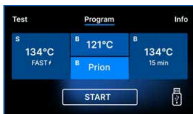
Écran EcoSteam BFL