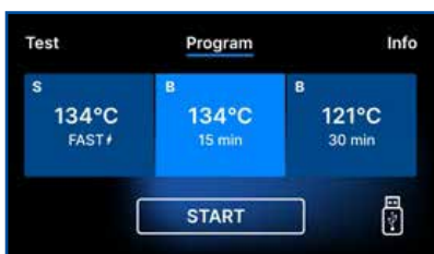
Écran EcoSteam FBS